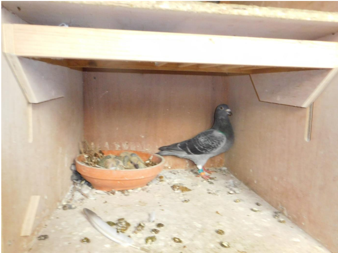
De "Loek" in zijn broedbak